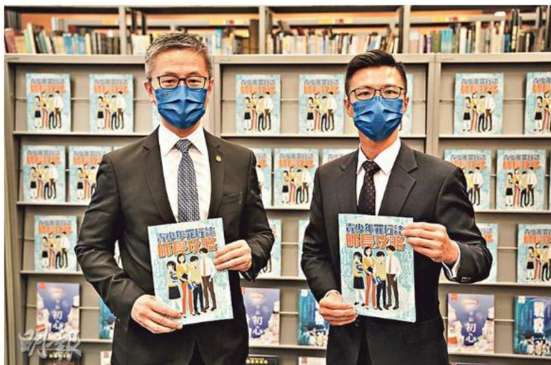
圖1-1 - 警務處長蕭澤頤（左）和公共關係部（傳媒聯絡及支援）高級警司梁.....