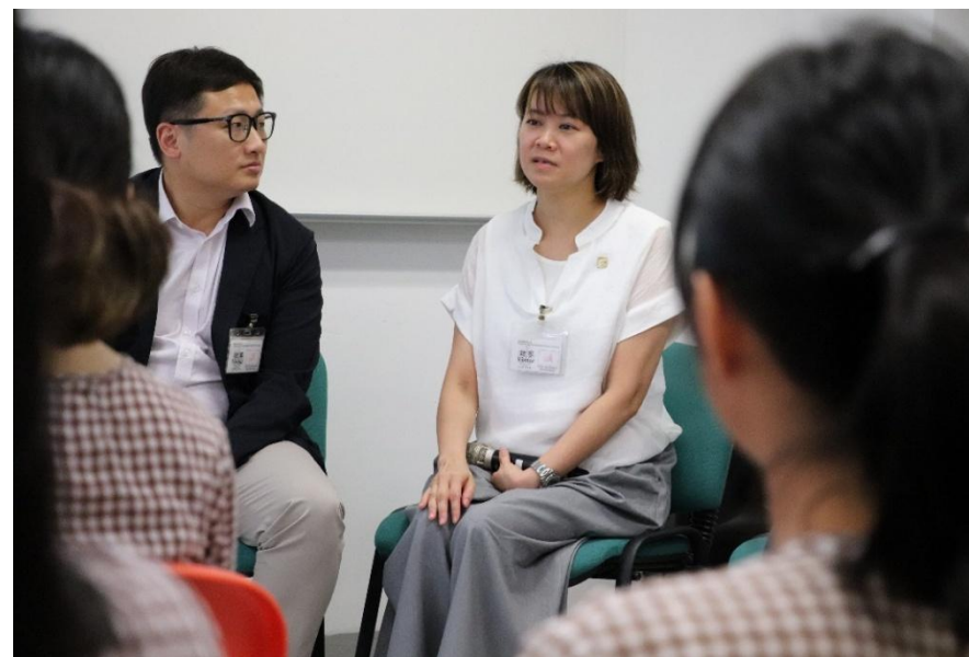
向女子院友介紹工程專業 Introducing the engineering profession to female inmates