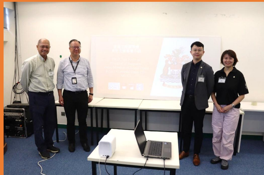
向有工程背景的男子院友介紹行業前景 Introducing career prospects to male inmates of engineering background