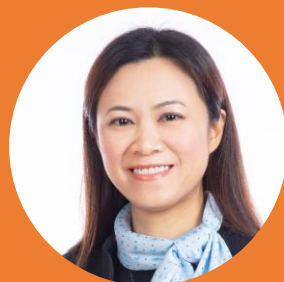
鄧銘心 議員、工程師 Ir Hon Michelle TANG